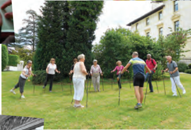
Initiation à la marche nordique