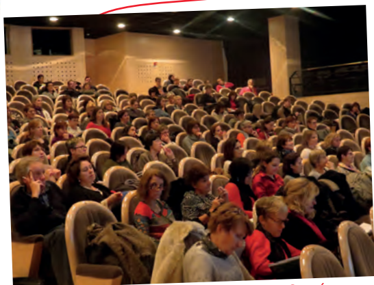
Conférence Ondes électromagnétiques et Santé : mieux comprendre pour mieux agir !