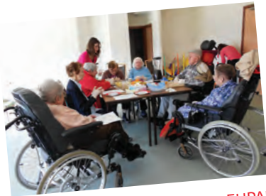
Rencontre Santé sur les sens en EHPAD