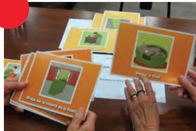
- = +, - de pollution = + de santé® Focus Air Intérieur