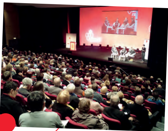
Conférence santé sur la douleur