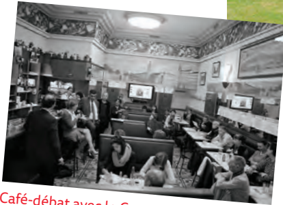
Café-débat avec le Centre Léon Bérard " Parlons Cancer & Environnement" " Bien-être en ville "