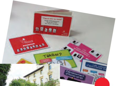
Outil " Zappe pas ta santé "