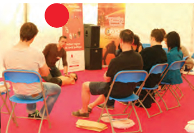
Initiation aux gestes de premiers secours