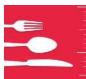
Léonie Cuvelier Diététicienne

Inscription obligatoire Nombre de places limité e.delanoue@mfara.fr