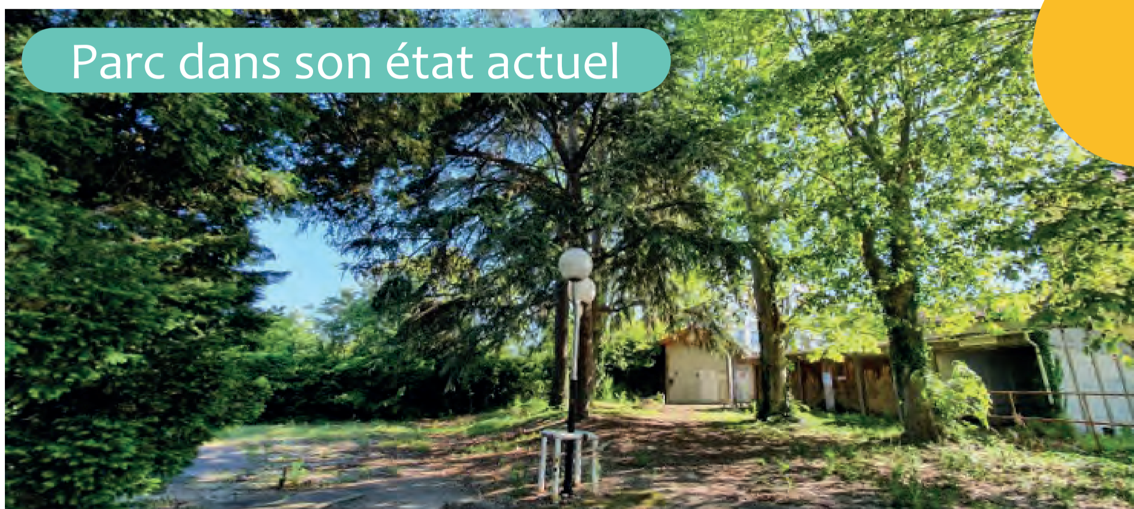
Parc dans son état actuel