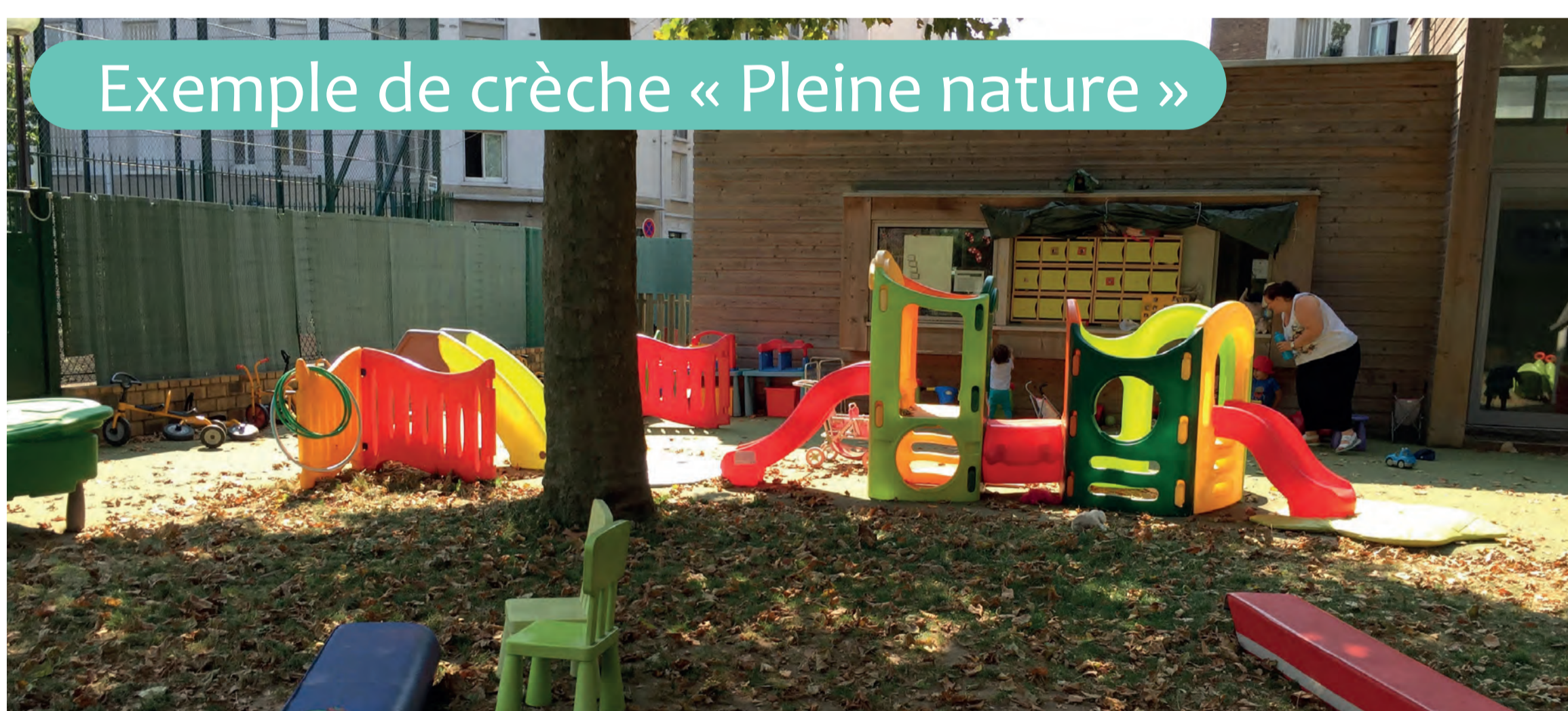
Exemple de crèche « Pleine nature »